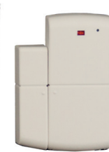
2 raam/deur contacten